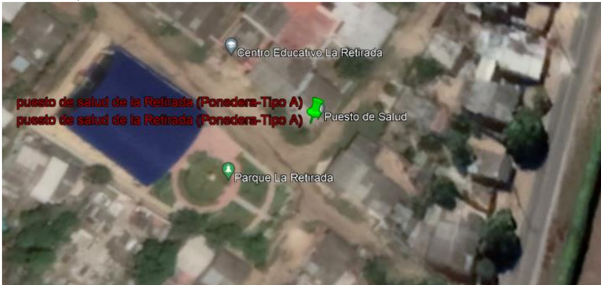
Figura 1. Localización del predio donde se planifica la ampliación del puesto de salud de La Retirada, donde se encuentra el individuo arbóreo con solicitud de tala.

LOCALIZACIÓN: Los árboles con solicitud de autorización de tala se encuentran en áreas de predio público, en jurisdicción del municipio de Ponedera – Atlántico, la Figura 1. Muestra la ubicación del sector donde se planifica la ampliación del puesto de salud de La Retirada.